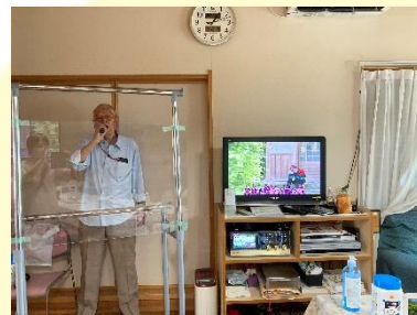
ビニールシートの中で熱唱！